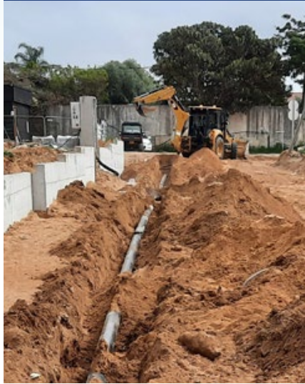
רחוב השלדג הנחת קו מים בקוטר 6"