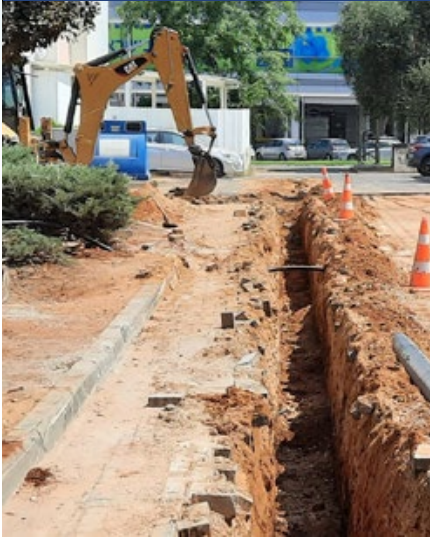
רחוב שקצר שדרוג קווי מים בקוטר 6"