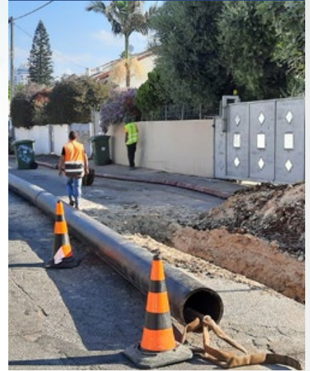
רחוב היסמין שדרוג קווי ביוב בשיטת ניפוף בקוטר 315 מ"מ