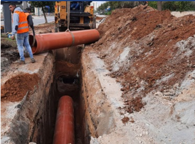
רחוב הפרדס שדרוג קווי ביוב בקטרים בין 355-630 מ"מ